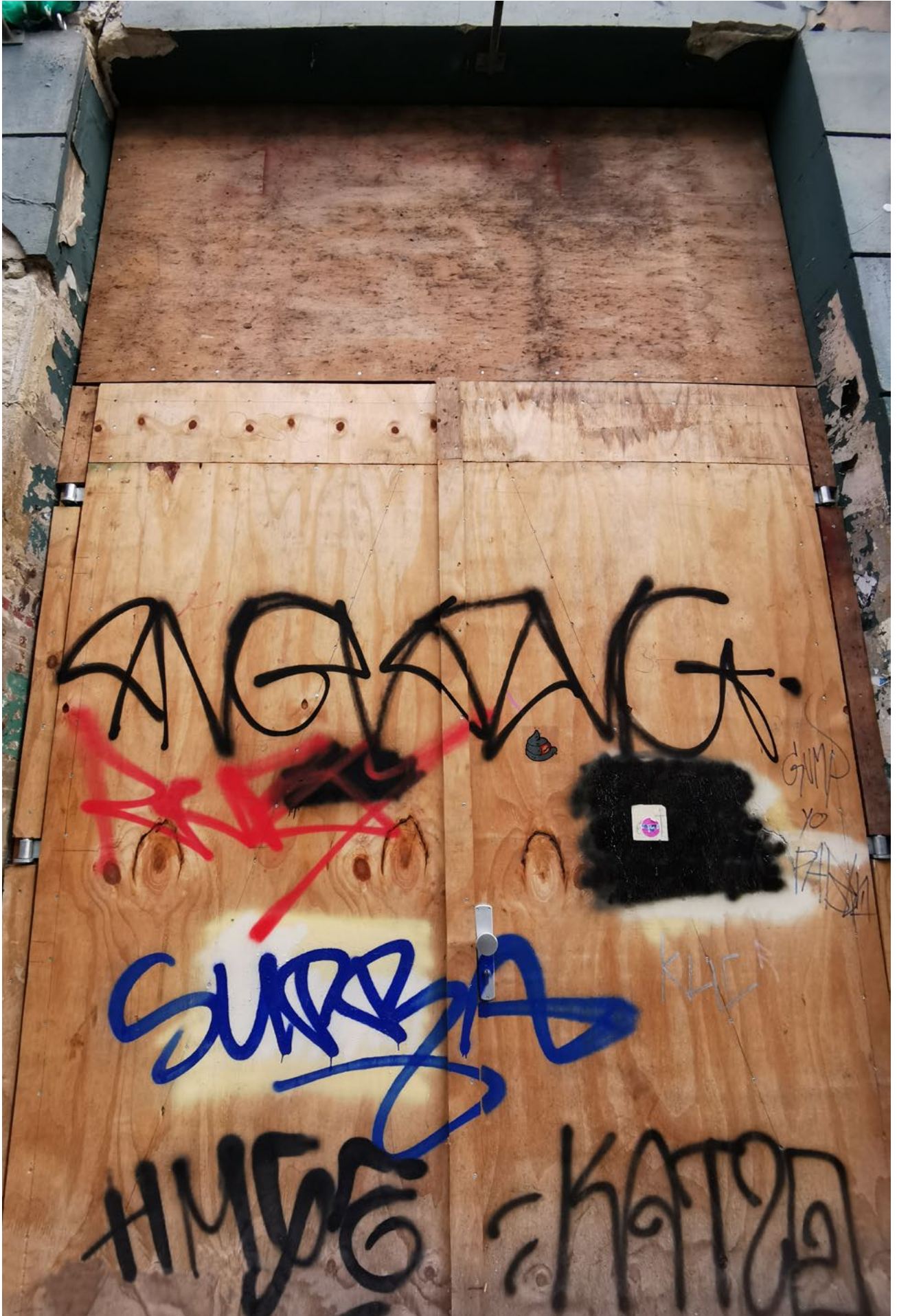
Hauseingang - Leerstand in Berlin.