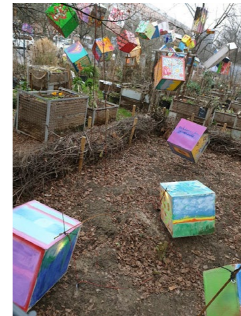
Reichtum: ein Geschenk – Armut: ein gesellschaftliches Problem

Bei Erbschaften geht es um nicht selbst erarbeiteten Reichtum. Die Blutsverwandtschaft ist Kriterium dafür, wer sozial besser oder schlechter gestellt wird. In Haushalten mit geringen Mitteln besteht dagegen die massive Gefahr, die Schulden anderer zu erben. Ein schlechter sozioökonomischer Status vererbt sich durch BAföG-Schulden, familiäre Schulden, frühen Tod und geringere Bezüge aus den Sozialversicherungen aufgrund schlechter Lebens- und Arbeitsbedingungen. Wer aus der Arbeitslosigkeit heraus ohne Startkapital einen Job bekommt, hat ein großes Problem: Das erste Gehalt kommt erst am Ende des Monats, mit viel Glück zur Monatsmitte. Die letzte Sozialleistung wurde dagegen am Anfang des Vormonats ausgezahlt. Darum beginnen Menschen, die aus der Armut kommen, jeden neuen Job direkt mit Schulden. Ein guter Status wird dagegen durch materielle Erbschaften, ohne Leistung zugeflossenes Vermögen und Privilegien gesichert.