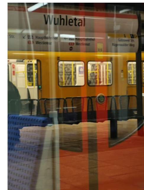
U-Bahn in Berlin: Mobilität ist Teil des Existenzminimums

Der Regelsatz sieht knapp 45 Euro für Mobilität vor. Damit muss nicht nur die Fortbewegung im unmittelbaren Wohnumfeld gewährleistet werden. Wer getrennt lebende Kinder trifft, seine alten Eltern besucht oder den Kontakt zu Verwandten pflegt, muss unter Umständen weitere Wege absolvieren. Darum ist sehr bedeutend, wie zukünftig ein Deutschland-Ticket ausgestaltet wird, wie leicht es zugänglich ist und ob es ein bundesweites Sozialticket geben wird. Wo ÖPNV fehlt, braucht es weitergehende Mobilitätskonzepte, zum Beispiel Sharing-Angebote für Verkehrsmittel wie Autos, Krafträder und E-Bikes, die jede:r nutzen kann. Sichere Fußwege und ein gut ausgebautes Radwegenetz sind im Interesse der Menschen, die nicht nur mit dem Auto unterwegs sein können.