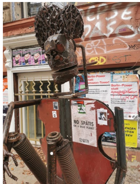
Straßenkunst in Berlin

Die Gefahr, trotz Vollzeitbeschäftigung unter der Armutsschwelle zu leben, ist bei Schwarzen Frauen (22 Prozent), muslimischen Männern (21 Prozent) und asiatischen Männern (19 Prozent) etwa viermal so hoch bei nicht rassistisch markierten Männern und Frauen (5 Prozent).