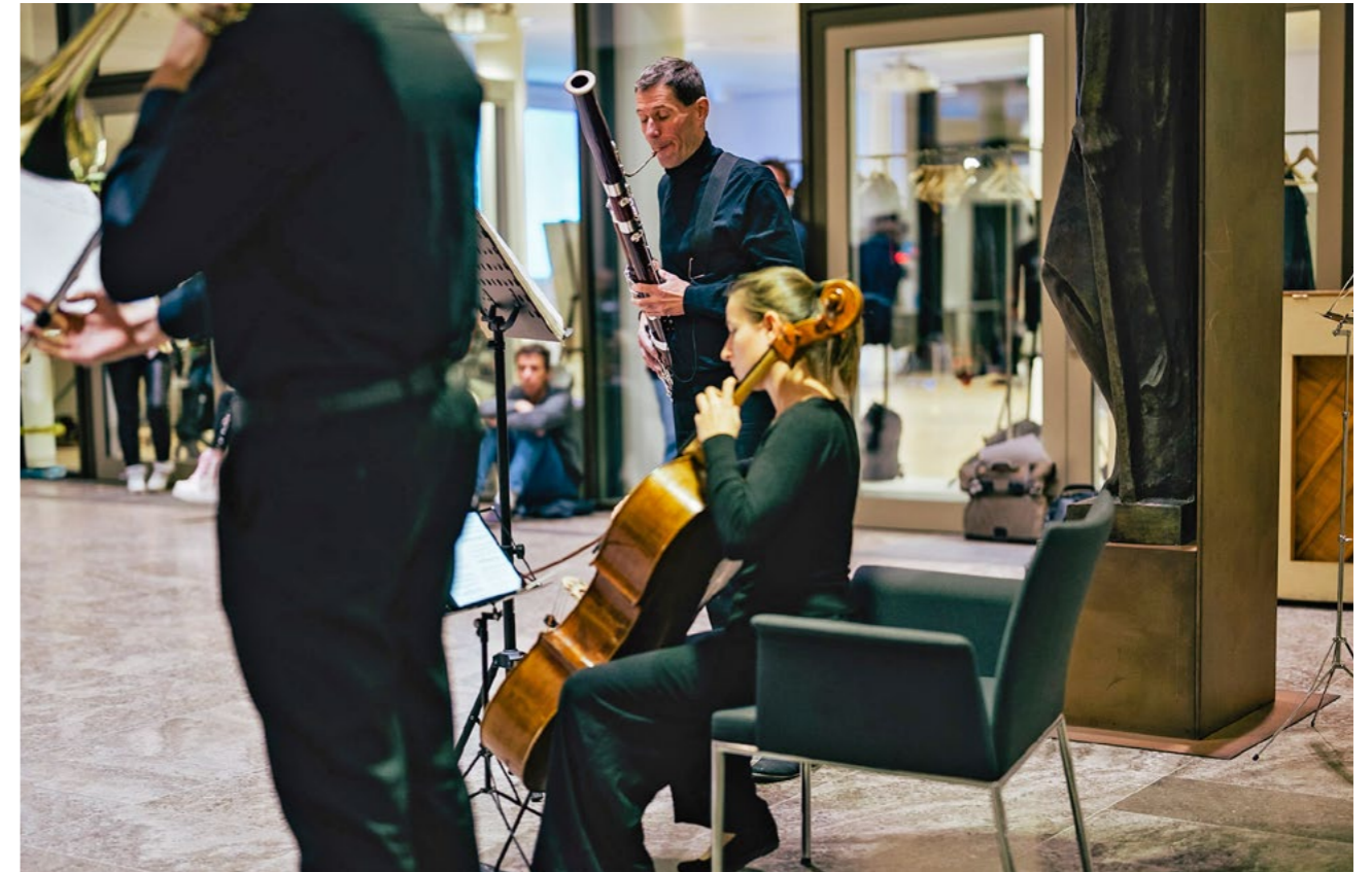
Wir spielen uns auf gegen Armut – Aktion und Konzert auf dem Treffen der Menschen mit Armutserfahrung