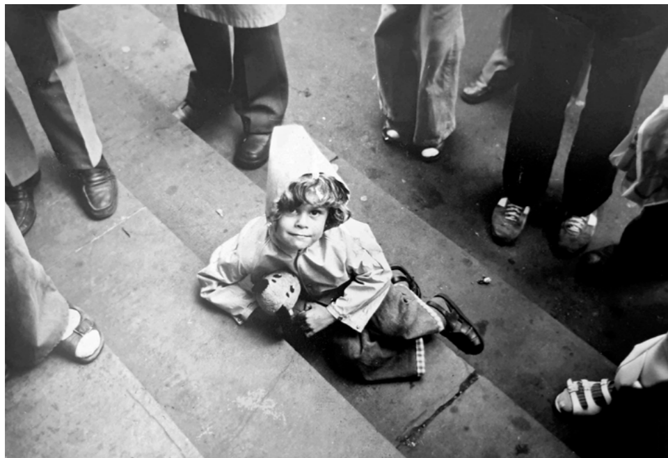
Kinder gehören in den Mittelpunkt

Arme Jugendliche haben es beim Berufseinstieg besonders schwer. Vor allem Jugendliche ohne oder mit niedrigem Schulabschluss sind benachteiligt. Der Bildungsgrad der Eltern spielt eine wesentliche Rolle für die Chancen der jungen Menschen. Kinder und Jugendliche von Eltern mit niedrigem Bildungsabschluss hatten 2022 eine Armutsgefährdungsquote von 37,6 Prozent, während die Quote bei Kindern und Jugendlichen von Eltern mit mittlerem Bildungsabschluss bei 14,5 Prozent und bei Kindern von Eltern mit höherem Bildungsabschluss bei nur 6,7 Prozent lag.