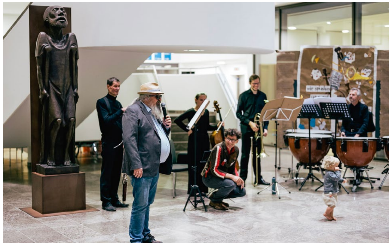
Wir spielen uns auf gegen Armut – Konzert und Aktion auf dem Treffen der Menschen mit Armutserfahrung

www.armuts-und-reichtumsbericht.de/SharedDocs/Downloads/Service/Studien/7-studie-diw-econ.pdf?__blob=publicationFile&v=2