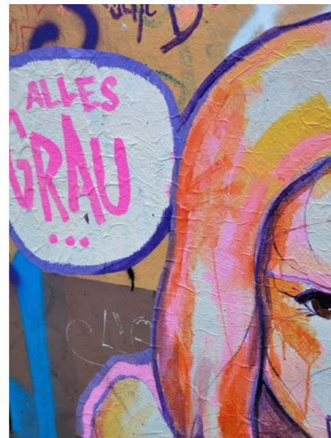
Ohne Kultur keine Begegnung – öffentliche Kunst in Berlin