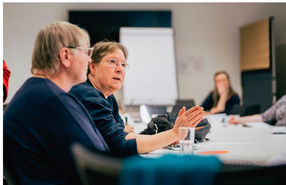
Politische Diskussionen auf dem Treffen der Menschen mit Armutserfahrung 2024

Demokratie ist lebendig, wenn sie auf jeder Ebene wachsen und sich weiterentwickeln kann. Mitbestimmung muss in jedem Fall selbstverständlich sein. Verwaltungen dürfen nicht im Hintergrund dominieren und Entscheidungen qua vermeintlicher Fachlichkeit faktisch vorgeben. Auch in Sozialleistungsbehörden wie dem Jobcenter und dem Sozialamt sowie bei sozialpolitischen Maßnahmen wie zum Beispiel dem sozialen Arbeitsmarkt muss Mitbestimmung selbstverständlich werden. Die Aufklärung über Missstände, Perspektiven der Weiterentwicklung und Rechtsumsetzung sowie Optimierungs- und Verbesserungspotenziale sind unverzichtbare Beteiligungsthemen. Damit neue Beteiligungsformen funktionieren, müssen die entsprechenden Räume, Ressourcen und Teilhabeinstrumente bereitstehen. Dazu gehört auch, Beteiligungsformate im Rahmen der Medienöffentlichkeit zu erleichtern und zu fördern. Beteiligung ist entscheidend für unsere Demokratie. Demokratie und Konflikt gehören zusammen; nötig ist daher eine engagierte demokratische Streit- und Debattenkultur, die auch Menschen mit wenig Einkommen und Ressourcen offensteht.