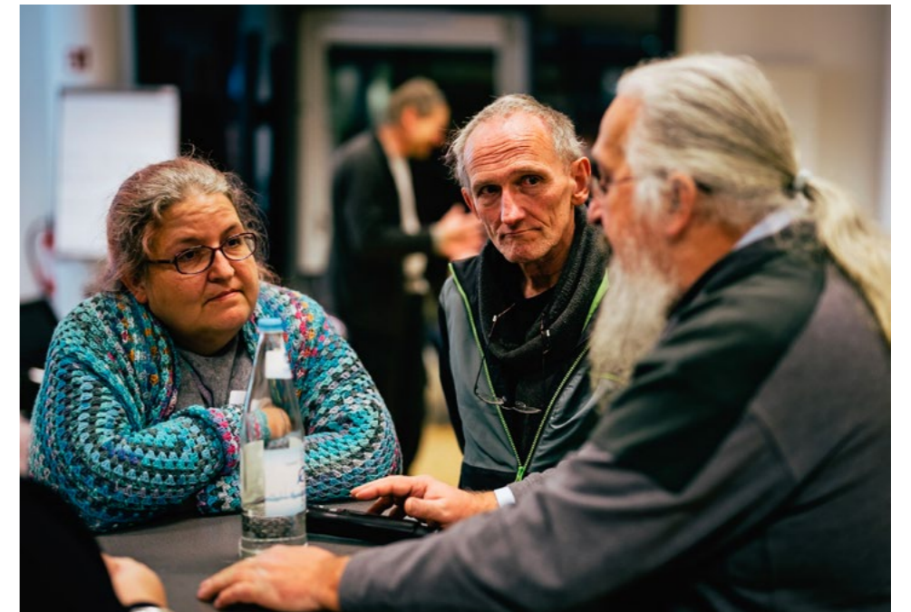
Diskussion und Austausch auf dem Treffen der Menschen mit Armuts- erfahrung 2024

www.destatis.de/DE/Themen/Gesellschaft-Umwelt/Einkommen-Konsum-Lebensbedingungen/Lebensbedingungen-Armutsgefaehrung/_inhalt.html#250422