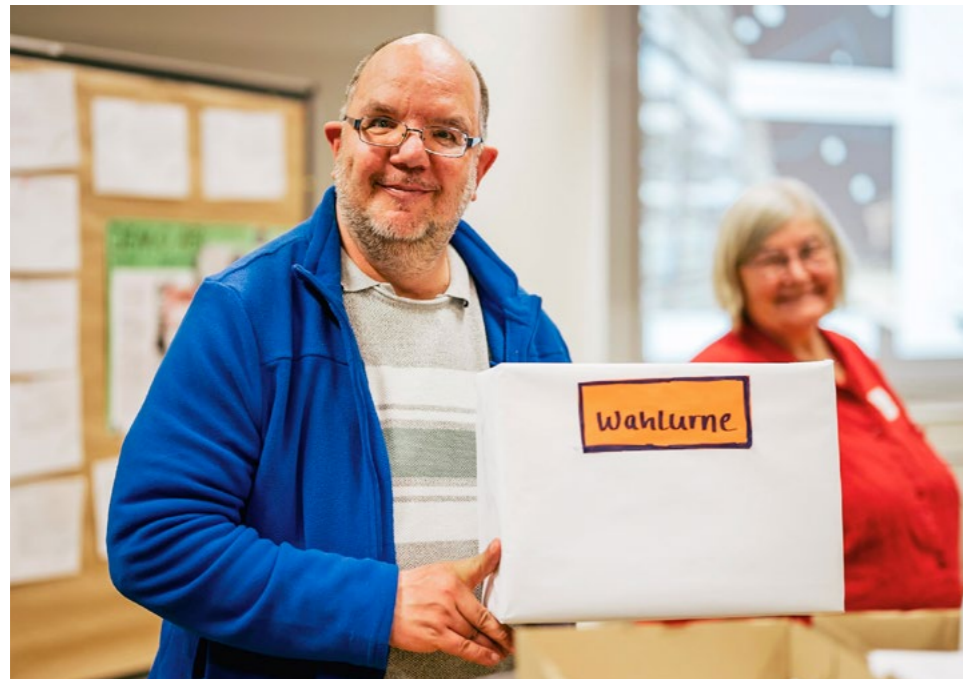
Wahlen auf dem Treffen der Menschen mit Armutserfahrung 2024

Menschen mit Armutserfahrung erleben ihre Lage oft als strukturelle Gewalt. Sie erfahren ständig, in ihren Möglichkeiten eingeschränkt und nicht ernst genommen zu werden. Diese Erfahrungen wurden durch Pandemie und Inflation weiter verstärkt. Gewalterfahrungen potenzieren sich in sozialen Zusammenhängen, die von Armut geprägt sind. Die Reaktionen darauf sind oft hilflos bis autoritär: in der Schule, im behördlichen Umgang.