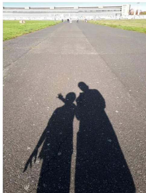
Schattenbilder auf dem Tempelhofer Feld in Berlin