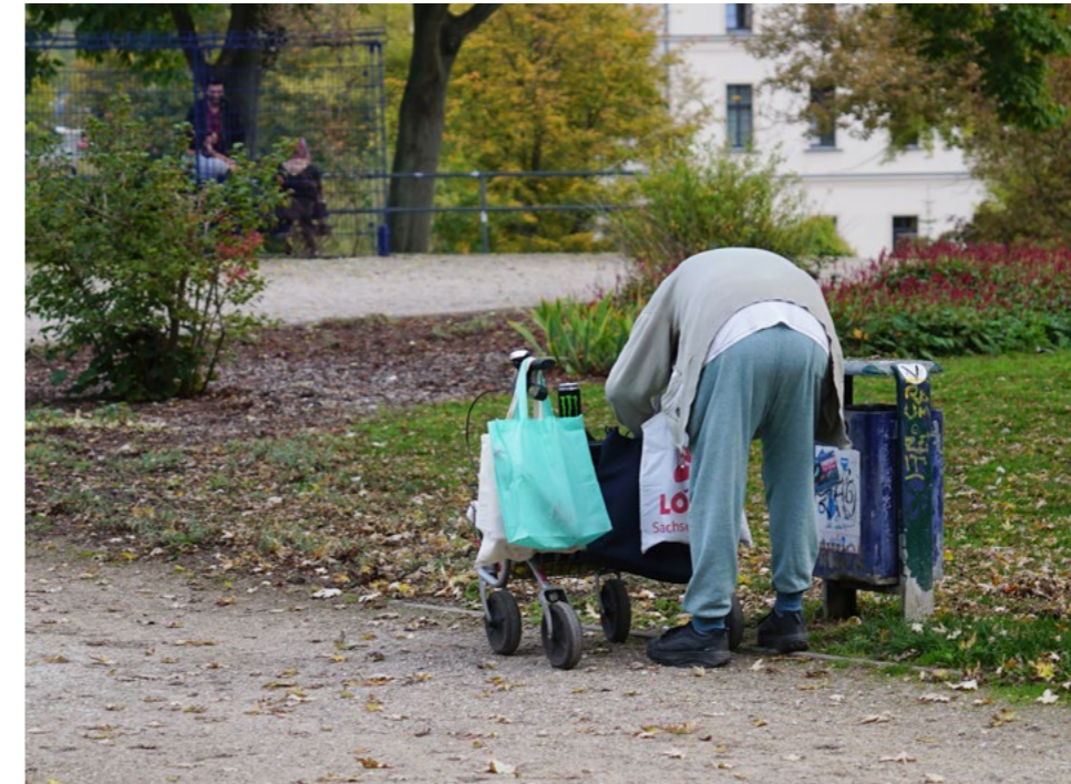
Altersarmut: Immer mehr Senior:innen stocken ihr schmales Einkommen mit Pfandsammeln auf

www.nationale-armutskonferenz.de/wp-content/uploads/2019/04/2019_4_30-nak-Botschaften-Rente-Altersarmut.pdf